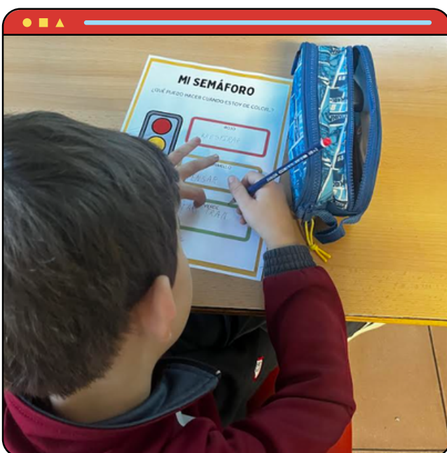
Equipo de Orientación

Porque puede que no tengamos una varita mágica, pero sí algo mucho mejor: la convicción de que cada alumno merece ser comprendido, acompañado y cuidado. Y eso, con todo lo que implica, seguirá siendo siempre el corazón de nuestra labor.